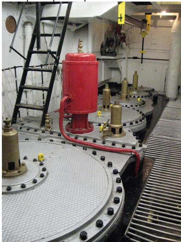
Parte superior de sala de maquinas

espacios para acercarse a las piezas en movimiento del motor a fin de refrigerar son mínimos y para ir de un punto a otro los espacios para desplazarse lo son también.