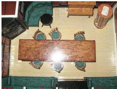
Cámara de oficiales

Entrando desde la popa lo que encontramos es el lugar donde estaba el torpedo, en el compartimento, en parte dormían los marineros y los foguistas, otra parte de ellos los hacía también en cubierta. El descanso se hacía en los coys con hasta tres niveles de colchones colgantes, por decirlo de alguna manera, también dormían en cubierta y guardaban los coys en unos cubículos laterales. En el compartimento siguiente estaba el espacio para la comida y esparcimiento, para los marineros y foguistas, también allí dormían.