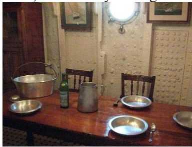
Comedor de marineros y foguistas

La cubierta tiene varias posibilidades de descenso a distintas partes del barco, uno es hacia popa, hacia la proa y debajo de la cabina de navegación, la cocina. En la entrada desde popa podemos bajar hacia lo camarotes de oficiales o del capitán del barco, continúa y tenemos lugar de descanso de suboficiales, tanto a babor como a estribor, también un generador eléctrico de corriente alterna, y en la parte central hay un conducto hacia la sala de máquinas. Contiguo a esto, antes de descender, hay un pequeño taller donde se hacía reparación y armado de piezas con torno, fresa y perforadora. Además cercano a esta puerta se encuentra el comedor de de los foguistas. Es notable también observar el contraste que hay en entre el lugar de reunión de los oficiales, marineros y los foguistas es tajante.