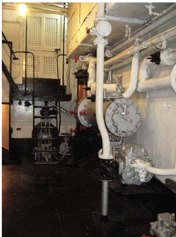
Sala de máquinas parte inferior