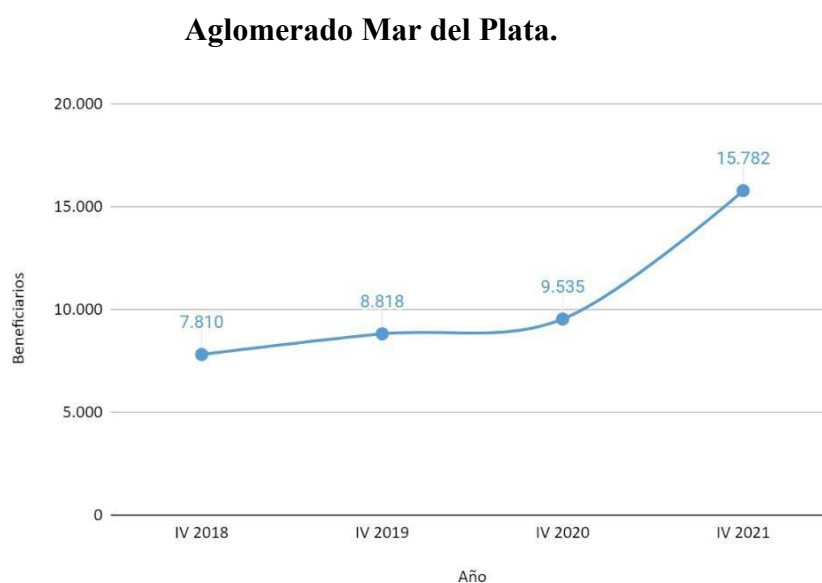
Gráfico N°1: Titulares del programa PROG.RES.AR. 4T 2018 - 2021.

Fuente: Elaboración propia en base a información suministrada por el ME.